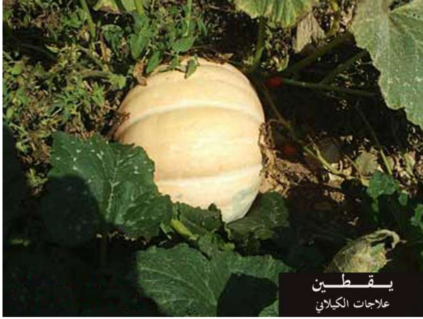
يقطين علاجات الكيلاني