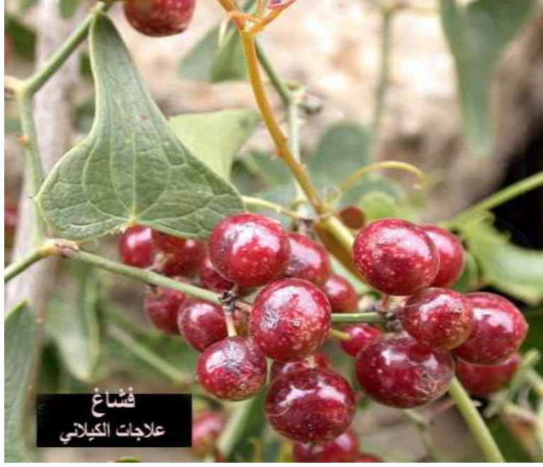
فشاع علاجات الكيلاني

الجزء المستخدم من النبات: هو الجذر الذي عادة ما يقلع في أي وقت خلال العام. وهناك نوعان من الفشاع نوع به أشواك ويعرف بالشانك وأوراقه مستديرة وازهاره على هيئة سنابل أو عناقيد وثماره مدورة ويتحول إلى اللون الأحمر عند النضج، والنوع الثاني غير شانك ناعم ثماره تشبه إلى حد ما الترمس شكلاً لكنه أصغر وشديد السواد يحيط به بياض. ماذا قال عنه الطب القديم؟ :