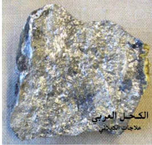
الكحل العربي علاجات الكيلاني

الفوائد: إن تركيب الاثمذ في تححيل العين مثبت قديماً حيث يعود استخدامه إلى مئات السنين الماضية. وقد أتى العلم الحديث ليؤكد فوائد استخدامه. ( وقد تبين أنه يدخل في معظم وصفات العيون الفرعونية). إضافة لعدد من الأحاديث النبوية التي تتكلم عن فوائده. قال عليه الصلاة والسلام: " خير أحوالكم الاثمذ . يجلو البصر و ينبت الشعر"