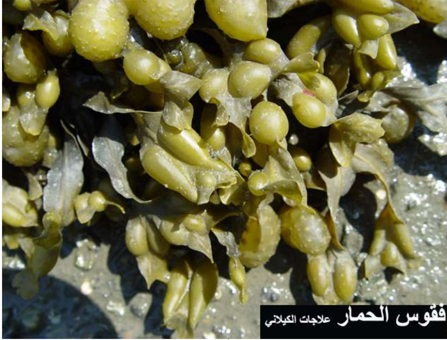
فقوس الحمار علاجات الكلياني

الفقوس يخفض الكوليسترول والضغط ويحمي من المعادن الثقيلة.