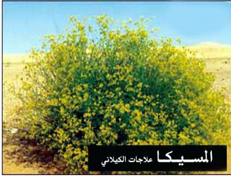
المسيكا علاجات الكيلاني

الجزء المستخدم من النبات: تستخدم جميع أجزاء النبات.