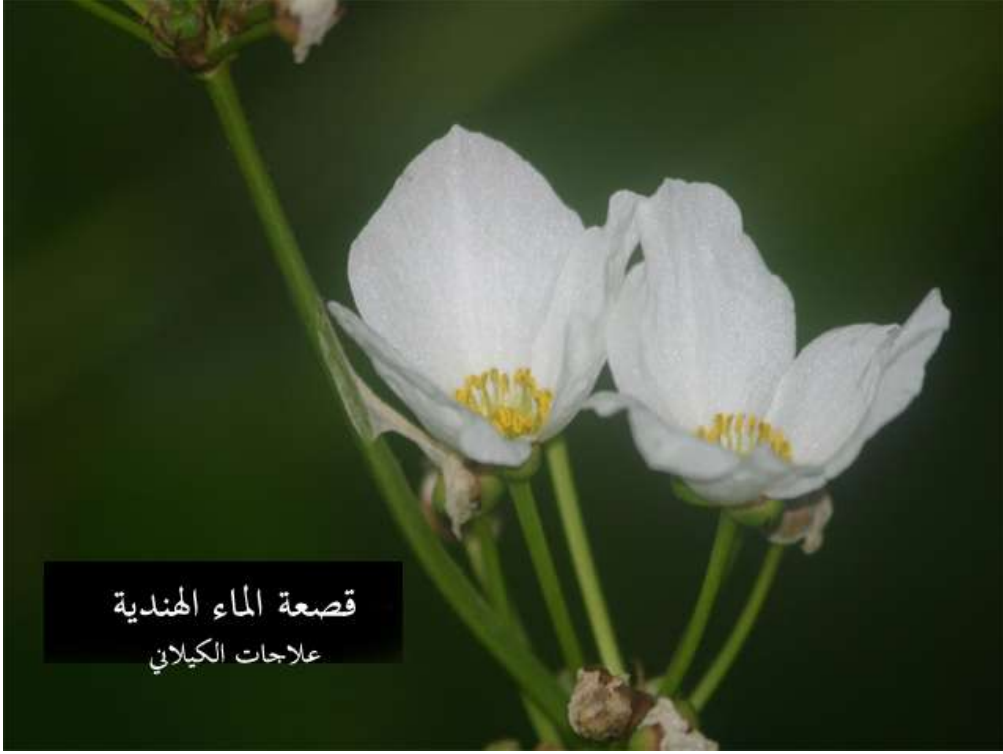
قصعة الماء الهندية علاجات الكيلاني

الجزء المستخدم من النبات جميع أجزاء النبات الهوائية. الموطن الأصلي للنبات: الهند وجنوبي الولايات المتحدة الأمريكية. وتستخدم قصعة الماء الهندية على نطاق واسع في الغرب فهي عشبة مقوية وقد أثبتت الأبحاث التي أجريت في نهاية التسعينات أن الاسياتيكوسيد والتانكونوسيد قد يقللان الخصوبة وهو اكتشاف يتناقض مع أحد استخدامات العشبة المأثورة حيث تؤخذ هذه العشبة في الهند لتحسين الخصوبة. كما تعرف هذه العشبة بأنها ترقق الدم وأنها تساعد في خفض مستويات سكر الدم عند تناولها بجرعات كبيرة.