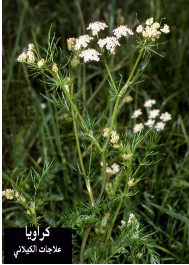
كراويا علاجات الكيلاني

الجزء المستعمل: منه الثمار والزيت الطيار. تستعمل الكراوية على نطاق واسع حيث تستعمل لتخفيض تضخم الغدة الدرقية وتؤخذ الكراوية لهذا الغرض على هيئة منقوع وذلك بوضع ملعقة صغيرة من ثمار الكراوية في كوب ثم يصب عليه الماء المغلي فوراً ويغطى ويترك لمدة 15 دقيقة ثم يصفى ويشرب من هذا المستحضر كوبان يومياً الأول بعد الإفطار والثاني بعد العشاء أو عند الذهاب إلى النوم ويجب الاستمرار على هذا العلاج لمدة لا تقل عن ثلاثة أشهر. تستخدم الكراوية كمضاد للمغص وتطبل البطن وطارد للغازات كما تقوم بتحسين راحة الفم والنفس وتحسن الشهية. كما تعمل الثمار كمدررة ومقشعة ومقوية وتستعمل عادة في وصفات التهابات الشعب والحكة. ويجب عدم استخدام الزيت الطيار داخلياً إلا باستشارة المختصين