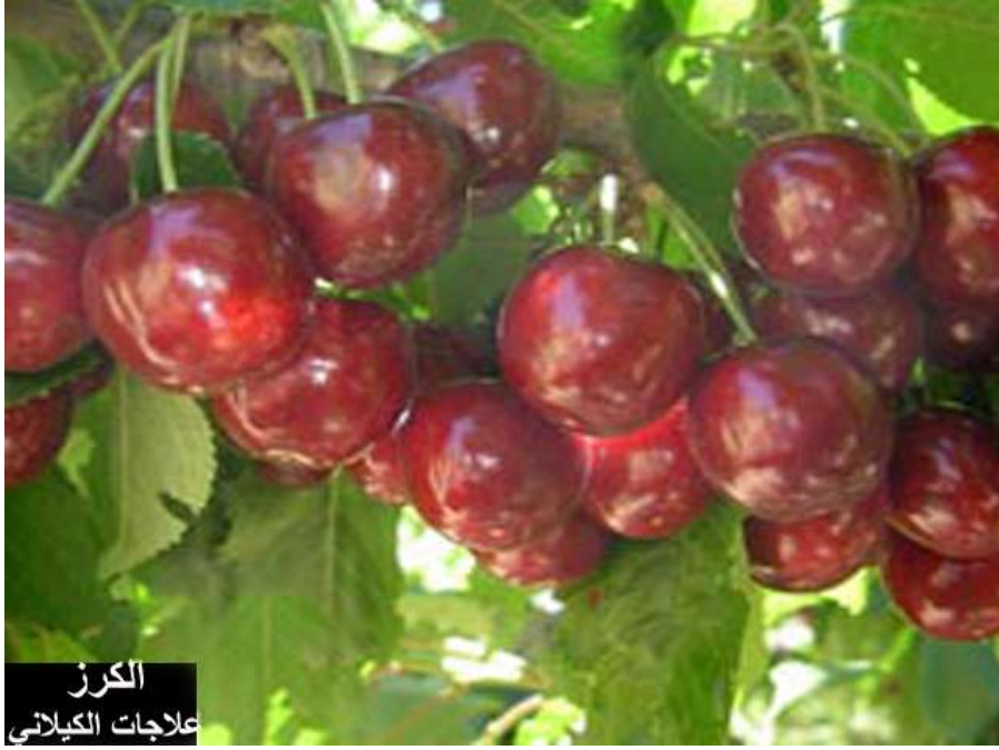
الكرز علاجات الكيلاني

الجزء المستعمل من نبات الكرز: الثمار والسيقان ماذا قيل عن الكرز في الطب القديم؟