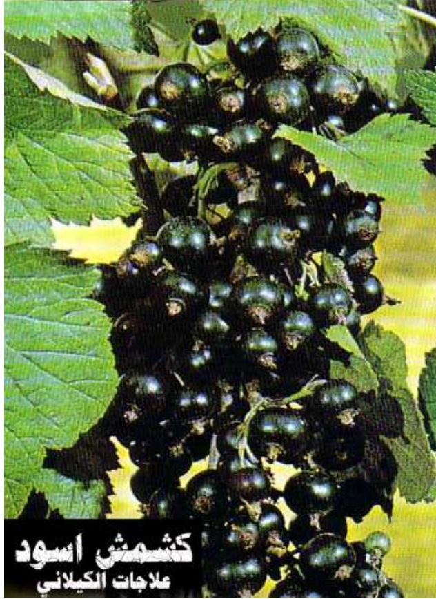
كشمش أسود علاجات الكيلاني

الأجزاء المستعملة الأوراق والثمار . الاستعمالات