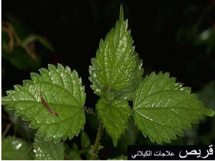
قريص علاجات الكلياني