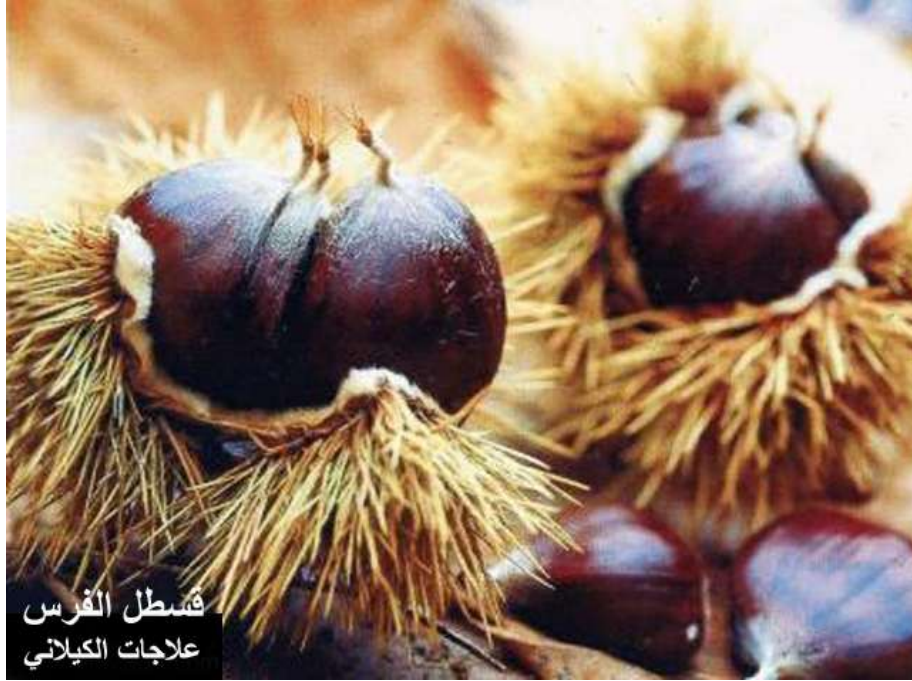
قسطل الفرس علاجات الكيلاني

كستناء الحصان: قشور النبات تحتوي على العديد من المواد الكيماوية التي تساعد في علاج البواسير، ان مواد مثل الاسكولين Ascolin والاسكين تقوي جدر الأوعية الدموية وتقلل من خطر المزيد من البواسير، وهناك مواد كيميائية اخرى في هذا العشب لها خواص مضادة للالتهاب.