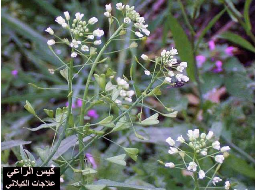
كيس الراعي علاجات الكيلاني

الأجزاء المستعملة الأجزاء الهوائية. الاستعمالات