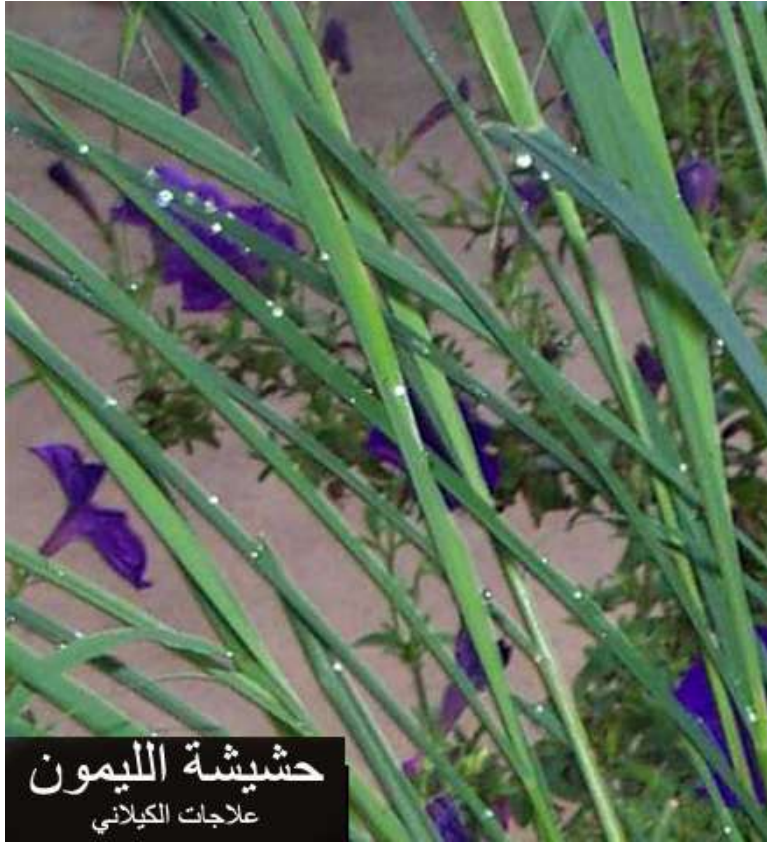
حشيشة الليمون علاجات الكيلاني

الأجزاء المستخدمة من النبات: الاوراق والزيت العطري. للمغص وعسر الهضم: تستعمل حشيشة الليمون بشكل عام لعلاج المشكلات الهضمية حيث ترخي عضلات المعدة والأمعاء وتزيل آلام المغص وانتفاخ البطن وهي ملائمة جداً للأطفال على وجه الخصوص ويستعمل ملعقة صغيرة من مسحوق النبات على نصف كوب ماء مغلي ويترك خمس دقائق ثم يشرب. لاحتقان الطحال: وتستعمل حشيشة الليمون على هيئة مستحلب يحضر بوضع ملء ملعقة كبيرة من مسحوق الأوراق في كوب ثم يملأ بالماء المغلي ويترك لمدة عشر دقائق ثم يصفى ويشرب منه كوب بعد الفطور وآخر بعد العشاء مباشرة او عند الذهاب الى النوم، ويستمر على هذا العلاج لمدة اسبوع او حتى زوال الاحتقان في الطحال.